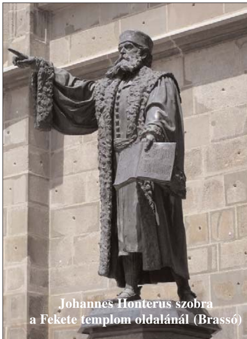
Johannes Honterus szobra a Fekete templom oldalánál (Brassó)

zolható - pápai és zsinati rendelkezések, papi nőtlenség, a szerzetesség intézménye, kiközösítés, ünnepnapok nagy száma - az mind tévelygés. A szertartásban a nemzeti nyelv használatát javasolja, mindehhez társadalmi és egyházszervezeti reformokat és széles körű művelődési programot ad. A műveltség fejlesztése, iskolák és nyomdák alapítása, ezek mind a világi hatóságok feladatkörébe tartoznak, vallja munkatársával, Philipp Melanchtonnal együtt. Melanchton ki is dolgozza 1528-ban ezt a programot, melynek fontos pontja az Ó- és Újszövetség német nyelvre fordítása. Luther szándéka egyértelmű: olvashassa mindenki a Bibliát, így a német nyelven olvasható Luther-Biblia a széles tömegek könyvévé válik. Ezzel tulajdonképpen az egységes német irodalmi nyelv megteremtését segítette elő.