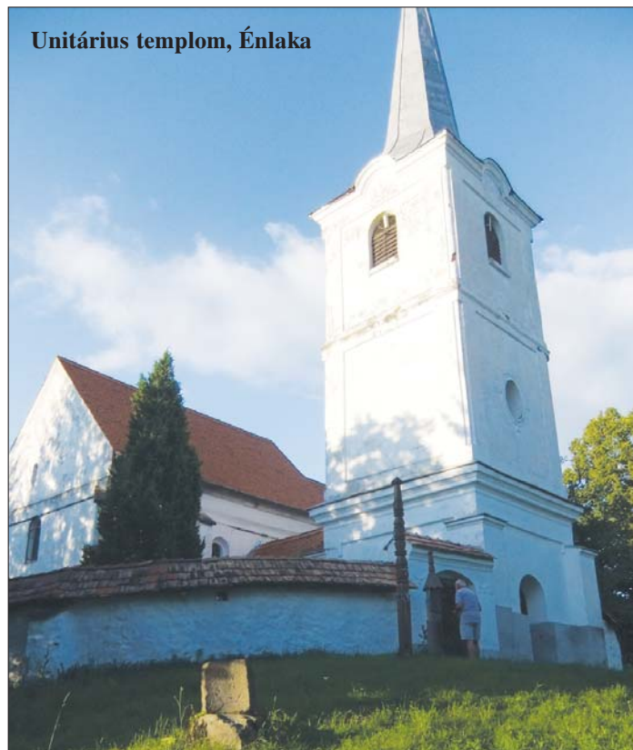
Unitárius templom, Énlaka

1550-ben hazatért, a következő évben már iskolamester Besztercén, aztán Kolozsváron, majd ugyanitt egyházi szolgálatba áll, plébános. 1555-ben már szülővárosa lutheri tanokra épülő új egyházának főlelkésze, ettől kezdve áll az erdélyi reformáció élére. Ekkor még szolgálja a lutheránus egyházat, hamarosan az erdélyi lutheránus magyarok püspökükké választják. Közben a Tiszántúlon új felfogás kap lábra az úrvacsora kérdésében, az új irányzat legtehetségesebb vezéralakja