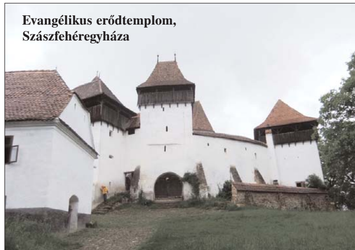
Evangélikus erődtemplom, Szászfehéregyháza

Már a reformáció kezdetén, 1548-ban az Erdélybe akadálytalanul beáramló reformált irányzatok között versengés támadt. A Tordán megtartott országgyűlés tudomásul veszi, hogy a lutheri irányzat gyökeret vert az országban. A szabad királyi szász városok: Nagyszeben, Segesvár, Szászsebes, Szászváros, Medgyes, Brassó, Beszterce és valamennyi szász település egységesen követte a lutheri tanokat. Ekkor még tiltják a helvét irányzatot, Luther is szakramentáriusoknak nevezi azokat, akik az úrvacsora általa hirdetett tanával ellenkezően vélekednek. Ez akkor elsősorban Zwingli Ulrich reformátor tanaira vonatkozott. Később aztán megtörténik az is (1604-ben), hogy a kassai főkapitány, Belgioso erőszakkal elveszi a lutheránusoktól a Szent Erzsébet-székesegyházat, amit fél évszázada ők használtak, és visszaadja a katolikusoknak. (Pedig ekkor még messze vagyunk a megerősödött és jól meg-