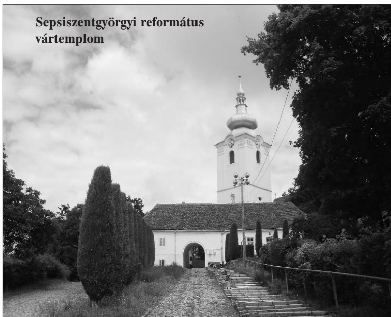
Sepsiszentgyörgyi református vártemplom

beteg fejedelem nagy horderejű kiváltságlevélben foglalta össze akarátát: „Erdélyországnak és a hozzá csatolt magyarországi részek igehirdetőinek, vagyis lelkészeinek egyenként és összesen fiaikat és lányaikat, s ezeknek mindkét nembeli örököseit és utódait, valamennyiüket megékesítjük... őket az ország valóságos, született és kétségtelen nemeseinek sorába bevonni,