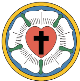
Az evangélikus egyház címere (Luther-címer)