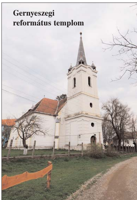
Gernyeszegi református templom

1590. október 21-én elkészül Vizsolyban a templom melletti nyomdában Károli Gáspár gönci református esperes fordításában az első magyar nyelvű teljes Biblia. Károli (Károlyi) Gáspár 1529-ben (vagy 1535 körül) Nagykárolyban született, eredeti neve Radics vagy Radicsics, egyes kutatók szerint Rados, minden bizonnyal délszláv eredetű családból. Magyarul is később tanult meg, református lelkész, egyházszerző, bibliafordító. Nagykárolyban, Brassóban, majd Wittenbergben tanult. 1562-ben már a Tiszántúlon lelkész, ekkor írja Két könyv című művét a magyarság romlásáról, az a véleménye, hogy „Isten a magyarok bűneiért bünteti őket a törökkel.” Egyházszerzői munkájának köszönhető, hogy a Tiszántúlon a reformáció megerősödik. 1563-tól Göncön lelkész, esperessé választják, nagy tekintélynek örvendő lelkészársai között. Fellép az Erdélyben egyre jobban terjedő